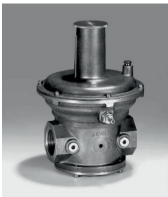
Umlaufregler Typ: KROMSCHRÖDER VAR