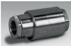
Gasrücktrittsicherung Typ: KROMSCHRÖDER GRS

Brenner in industriellen Thermoprozess- und Heizungsanlagen sowie Blockheizkraftwerken benötigen einen minimalen Versorgungsdruck. Steht am Brenner nicht genügend Gasdruck zur Verfügung, beispielsweise durch hohe Druckverluste im Leitungssystem, kann der Einsatz einer Gasdruckerhöhungseinrichtung notwendig werden. Besonders bei Biogasanlagen, in denen der Gasdruck verfahrensbedingt sehr niedrig ist, bietet sich der Einsatz an, wenn direkt ein Verbraucher – etwa ein BHKW – betrieben wird.